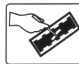
uvolněte zaseknutý papír