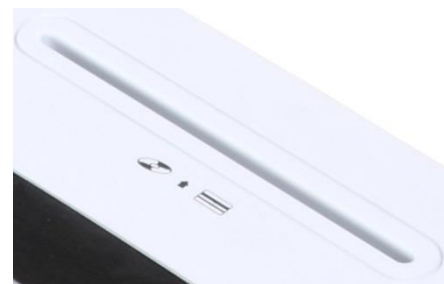
Samostatný vstup na CD a DVD